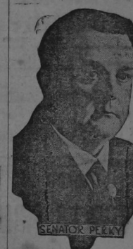
EL SENADOR PECKY, DE ESTADOS UNIDOS