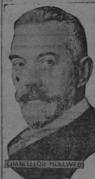
EL CANCELLER HOLLWEG DEL IMPERIO ALEMAN

ALEMANIA AUSTRIA ESTADOS UNIDOS INGLATERRA