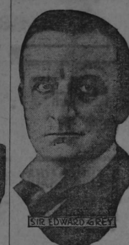
SIR EDWARD GREY, MINISTRO DE R.R. E.E. DE INGLATERRA