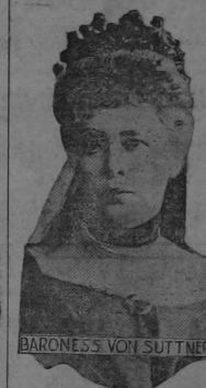
LA BARONESA VON SUTTNER, notable dama austriaca...